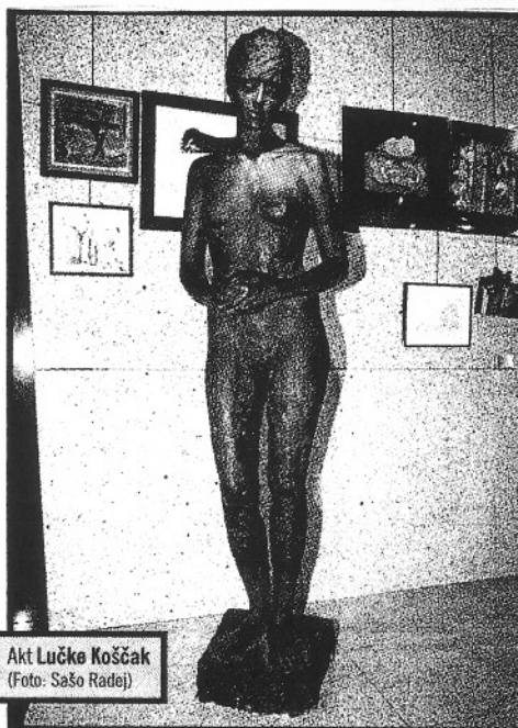
Akt Lučke Koščak